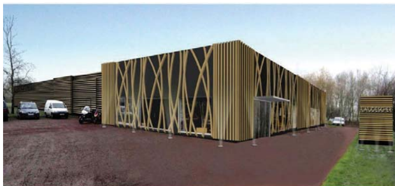
Actuellement des travaux de rénovation et d'agrandissement sont en cours. Il s'agit de revoir la partie bureaux et de faire la façade du bâtiment une vitrine extérieure du savoir-faire LAUDESCHER.

L'entreprise fut créée en 1965 par Marcel LAUDESCHER, menuisier. La grande aventure démarre lorsque le distributeur parisien pour qui il fabriquait des tréteaux en bois, rentrant des Etats-Unis, lui apporte un échantillon de claustra : le grossiste souhaite fabriquer ce produit en France et en série. L'artisan carentanais cherche et trouve ce process unique qu'est la technique d'entailage et d'assemblage qui permet de produire des panneaux légers mais de très forte résistance, facilement façonnables. Ces claustras séparatifs mais aussi décoratifs, utilisés dans les restaurants d'entreprise, dans les bureaux, plaisent beaucoup. LAUDESCHER est la seule société à maîtriser ce savoir faire et c'est ce qui lui a permis, dans les années 90, de développer toute une trame de claustras en bois massif et d'en faire un produit de première nécessité.