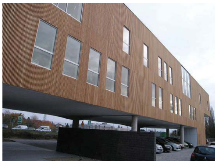
Siège social NEDAP - Cergy Pontoises