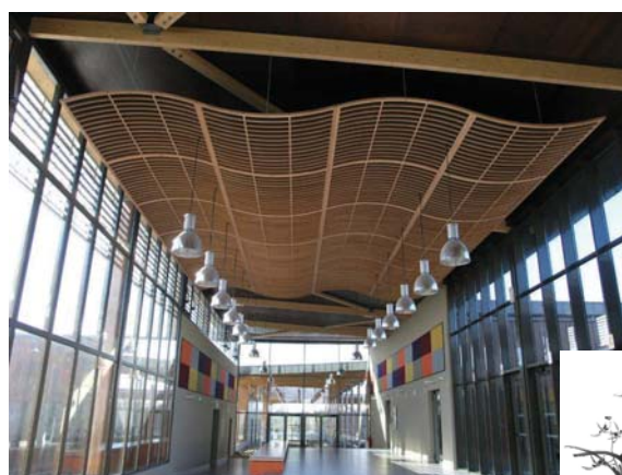
Collège HQE de la Mézière (Ile et Vilaine)

A ce jour, 32 personnes œuvrent au sein du groupe LAUDESCHER